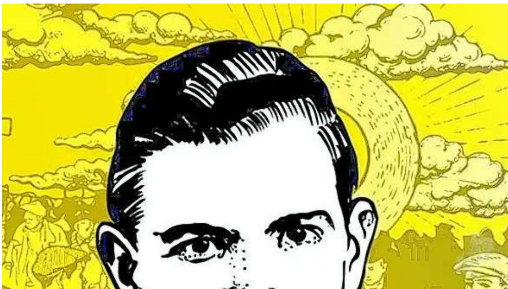
Henry Marannes gehört zu den 50 Märtyrern, die im Dezember 2025 im Auftrag von Papst Leo XIV. in Paris seliggesprochen wurden.

Der junge Franzose Henri Marannes verkündete im Zwangsarbeitslager das Evangelium – und wurde kurz vor Kriegsende erschlagen.